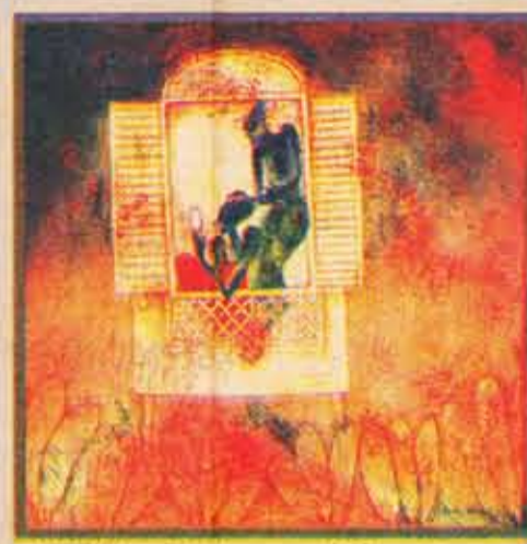
▲ Waiting For Love · 1995