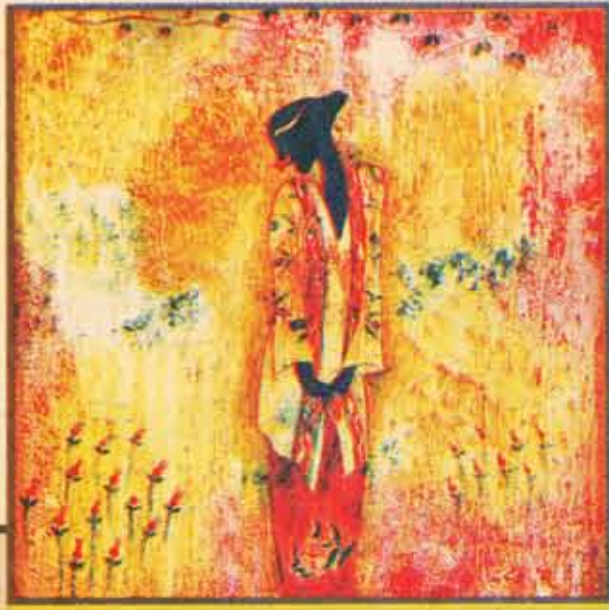
◀ Longing For Love · 1996