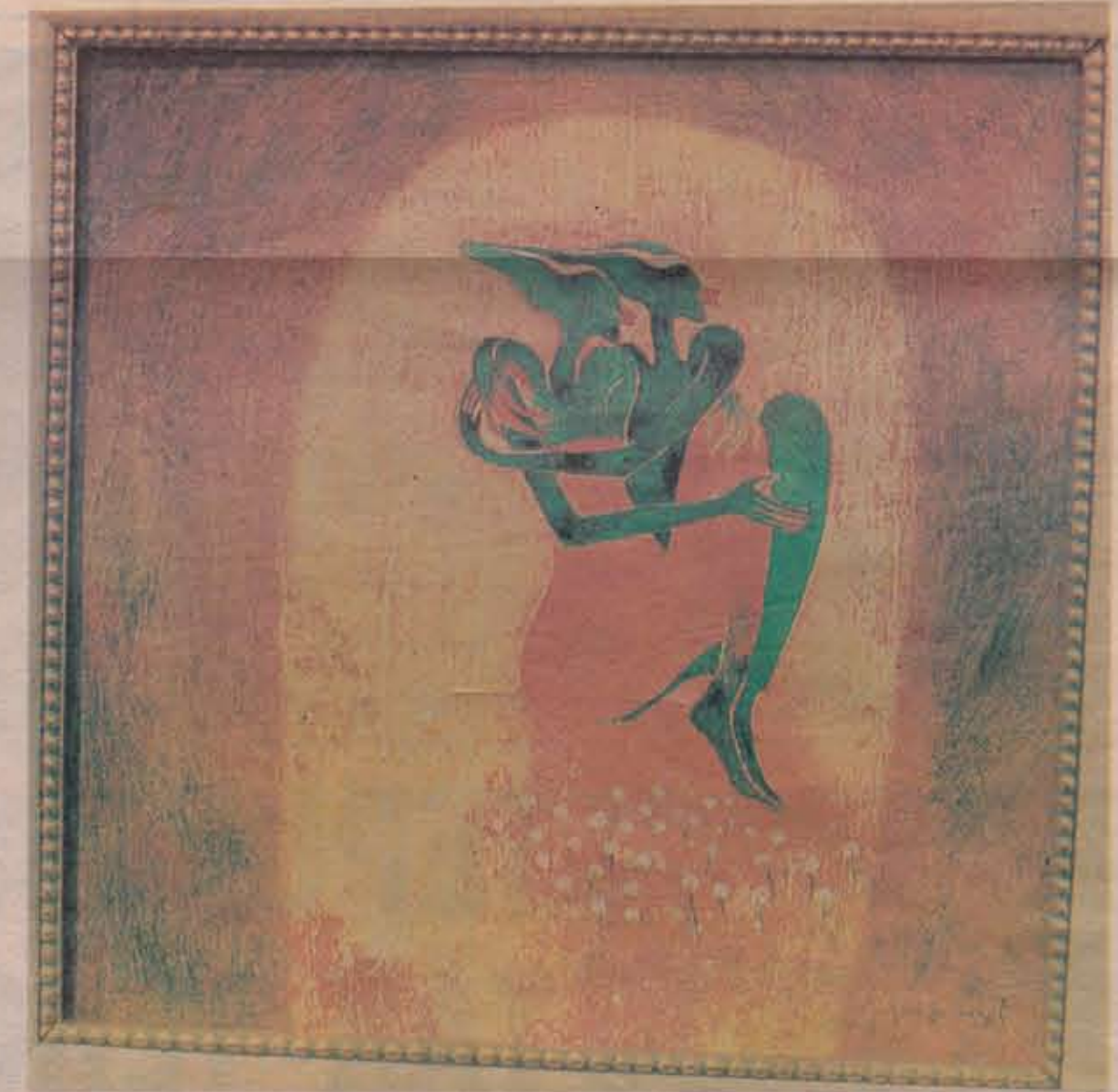
INDAH... lukisannya yang bertajuk For Being Together memaparkan kehidupan yang diidamkan oleh setiap insan selepas bercinta.