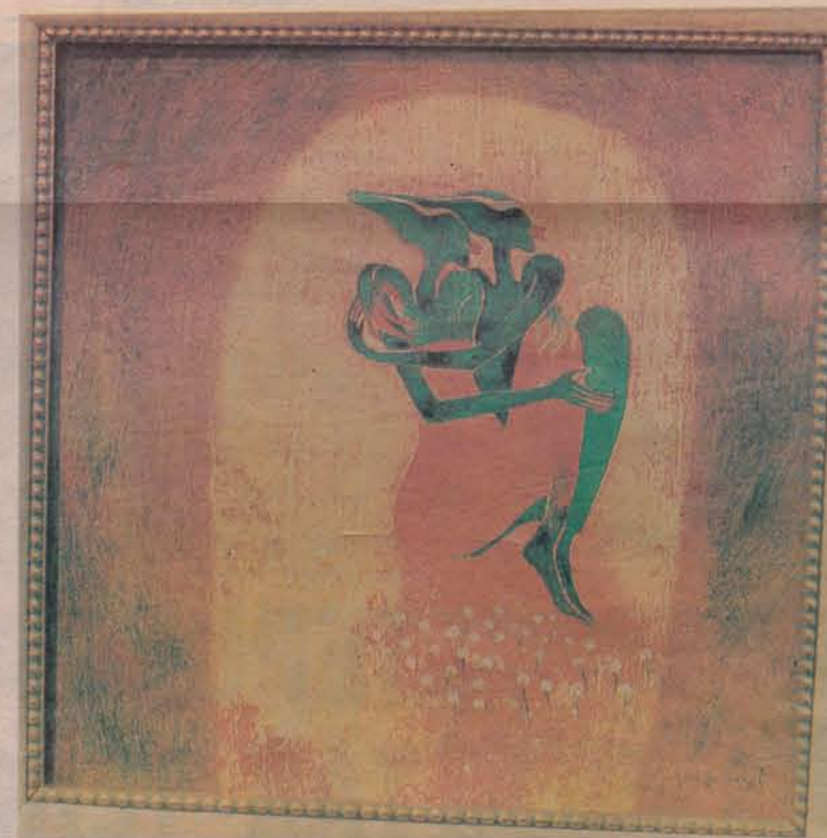
INDAH... lukisannya yang bertajuk For Being Together memaparkan kehidupan yang diidamkan oleh setiap insan selepas bercinta.